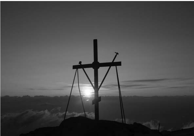
Ήλιοβασίλεμα στην κορυφή του Άθωνα