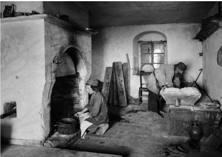
Γέρον και ὑποτακτικός