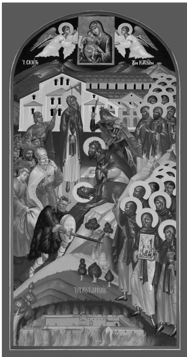
Οί Αγιορείτες Πατέρες, οί ἐπὶ Βέκκου μαρτυρήσαντες