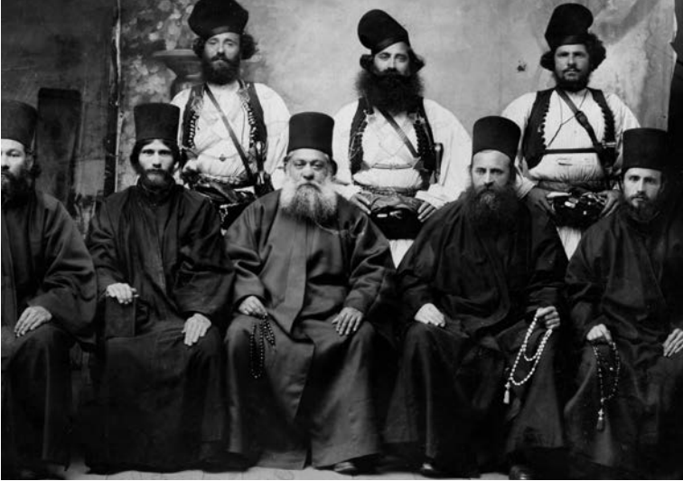
Ἱερά Κοινότης, ὁ ἱερός θεσμός τοῦ Ἁγίου Ὁρους