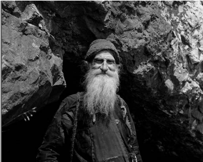
Γέρον άσκητής σπηλαιώτης