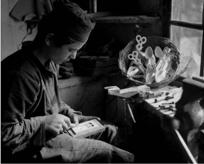
Νέος Μοναχός. Ξεκινάει μιὰ νέα ζωή