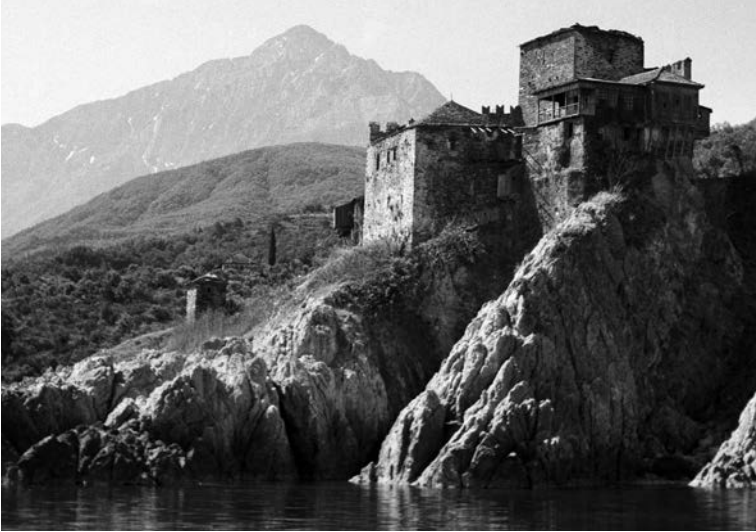
Μυλοπόταμος. Κάθισμα Αγίου Εϋσταθίου (Ιερά Μονή Μεγίστης Λαύρας)