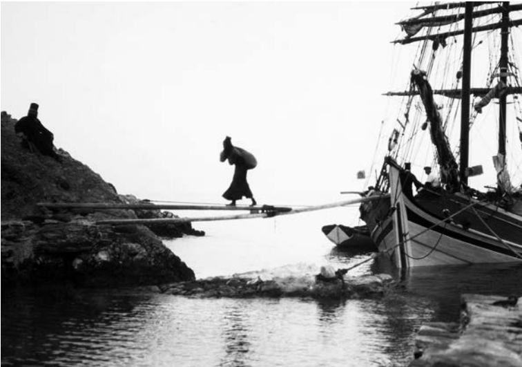
Άρσανᾶς. Μεταφορὰ προμηθειῶν