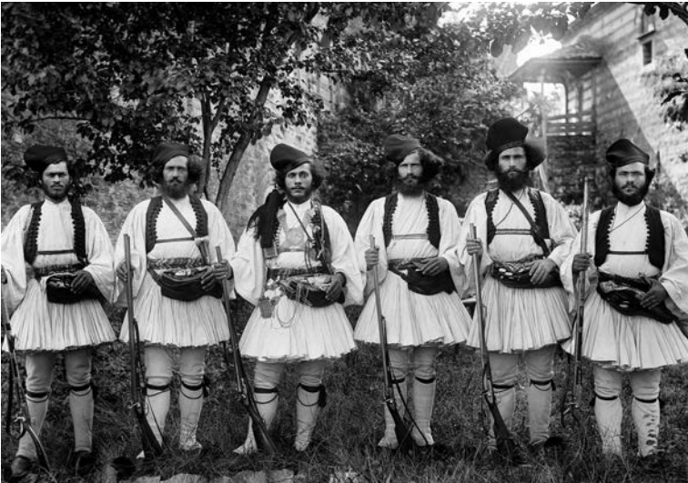
Οἱ φρουροὶ τοῦ Ἁγίου Ὁρους (Σερδάρηδες)