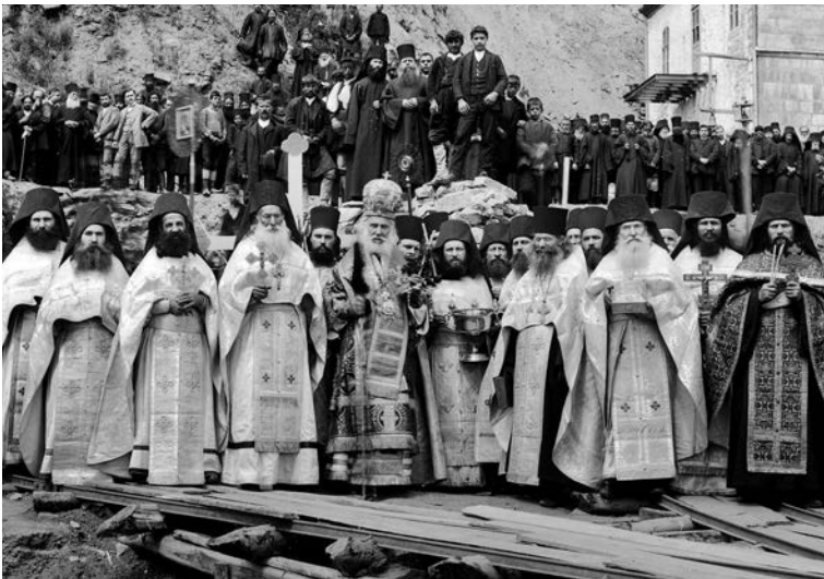
Πανήγυρις Θεοφανείων. Ἁγιασμός