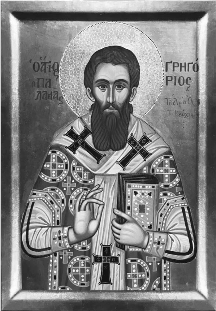
Ὁ ὑπέρμαχος τῆς Ὁρθοδοξίας Ἅγιος Γρηγόριος ὁ Παλαμᾶς